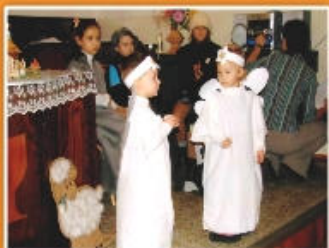
Dětská vánoční slavnost

Jsme rádi, že máme ve sboru děti. V současné době se jedná především o menší děti, které scházejí každou neděli v době bohoslužeb v nedělní škole. Seznamují se zde s biblickými příběhy a základy křesťanské víry.